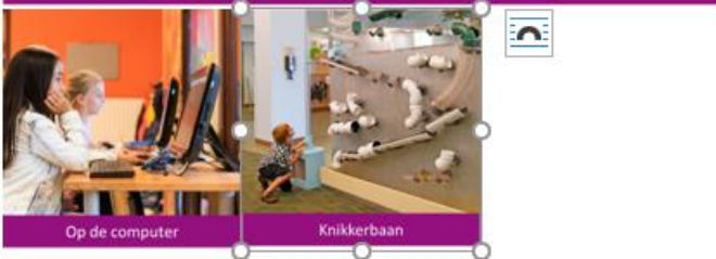
Op de computer